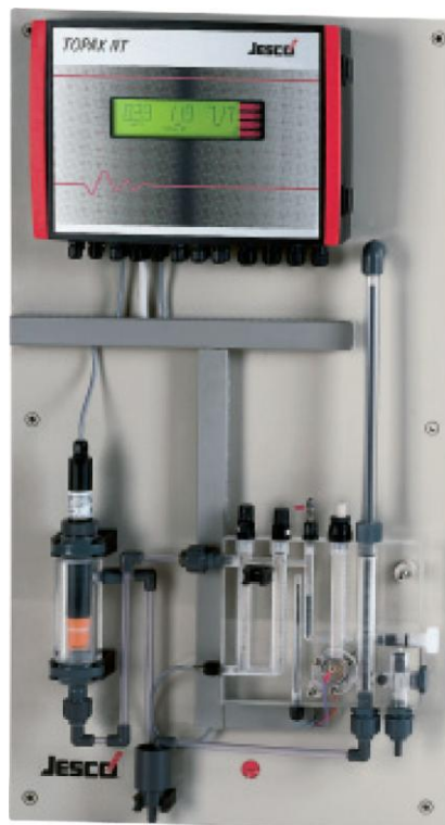
Regulátor a merací zosilňovač TOPAX NT

Panel JESCO-DCM01 je merací systém, ktorý bol navrhnutý podľa najnovšieho stavu elektroniky a sensoriky. Prídavné chemikálie, ktoré sú pri automatizovanej chemickej analýze normálne nevyhnutné, sa pri použití systému JESCO-DCM01 nemusia používať.