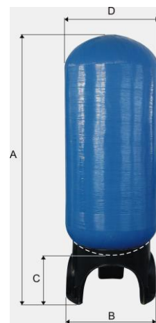
s horným a spodným závitom 4"