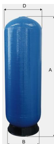
s horným závitom 2 1/2" alebo 4"

pracovný tlak max. 10 bar pracovná teplota max. 50 °C