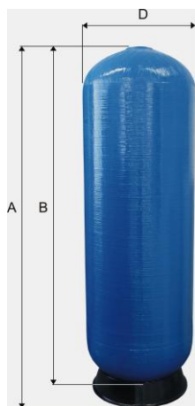
s horným závitom 4"